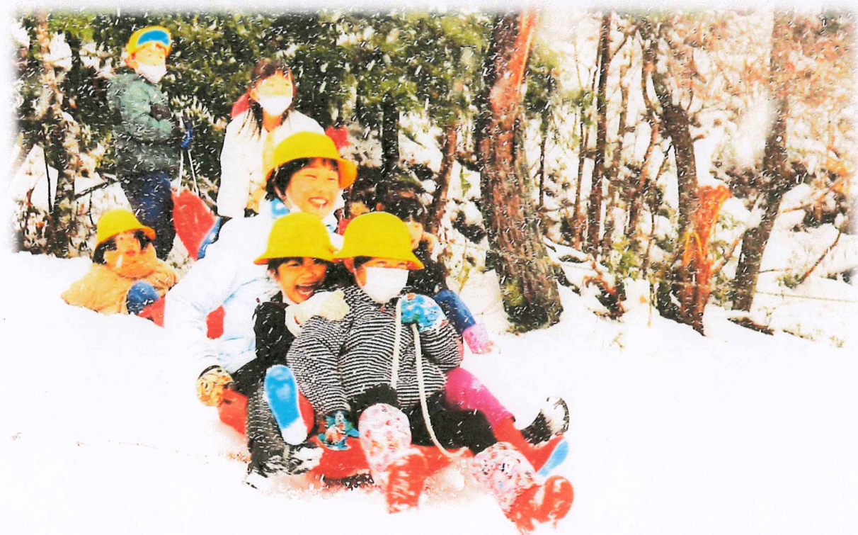
学校の裏山は 子どもたちの大好きな場所です。 〔城崎小学校で 12月16日〕